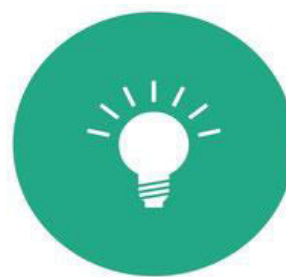
Forschung und Evaluation